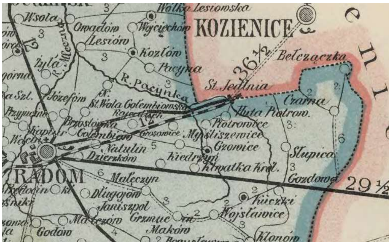
Stacja Jedlnia na mapie powiatu radomskiego z 1907 roku

Początki współczesnej Jedlni-Letniska były podobnie skromne jak wyżej opisanych miejscowości. Miejscowa stacja kolejowa powstała w okolicy mało zaludnionej. Trudno dociec czym kierowali się projektanci linii kolejowej ustalając przystanek niemal w szczerym polu. Dla administracji kolejowej istniał problem obsadzenia stacji Jedlni, bowiem nikt nie chciał tu pracować. Obsługa przystanku kolejowego w wolnych chwilach nie miała żadnych rozrywek. Stało się to nawet tematem żartów prasy w końcu XIX wieku 9 .