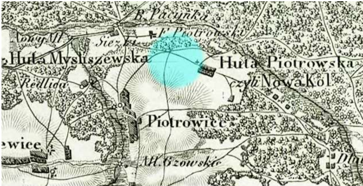
Fragment Topograficznej Karty Królestwa Polskiego z 1839 roku. Kolorem niebieskim zaznaczono przypuszczalny obszar współczesnej Jedlni-Letniska.

W pierwszej połowie XIX wieku na wschodnich krańcach majątku Piotrowice powstała niewielka kolonia zwana Hutą Piotrowską lub Nową Kolonią, a w późniejszym czasie przyjęła się nazwa Aleksandrów 5 .