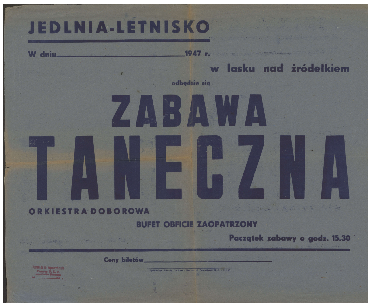
Plakat z 1947 roku

Według przekazów ruch turystyczny wzmógł się od 1947 roku i trwał do początku lat 50. XX wieku. Za wolne pokoje płacono wysokie ceny. W następnych latach rozpoczął się pewien regres osad letniskowych w rejonie Radomia (Garbatka, Rajec i Jedlnia-Letnisko). Wiązało się to z konkurencją państwowego Funduszu Wczasów Pracowniczych. Zmusiło to właścicieli willei na wynajem do poszerzenia oferty, zapewnienia lepszych warunków wypoczynku 38 .